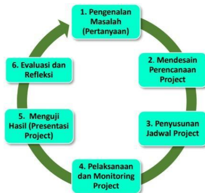
Gambar 4. Langkah-langkah pembelajaran berbasis proyek

hasil yang akan dievaluasi dan kemudian menjadi refleksi untuk perbaikan.