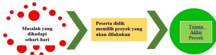
Gambar 3. Karakteristik Pembelajaran Berbasis Proyek

Pembelajaran berbasis proyek untuk penguatan Profil Pelajar Pancasila diselaraskan dengan potensi lokal yang menjadi ciri khas satuan pendidikan, capaian operasional pembelajaran, dapat mengakomodir keragaman minat bakat peserta didik dan mampu mengembangkan kecakapan hidup peserta didik. Penguatan Profil Pelajar Pancasila terdiri dari enam dimensi yaitu beriman, bertakwa kepada Tuhan Yang Maha Esa dan berakhlak mulia, berkebhinekaan global, gotong royong, mandiri, bernalar kritis dan kreatif.