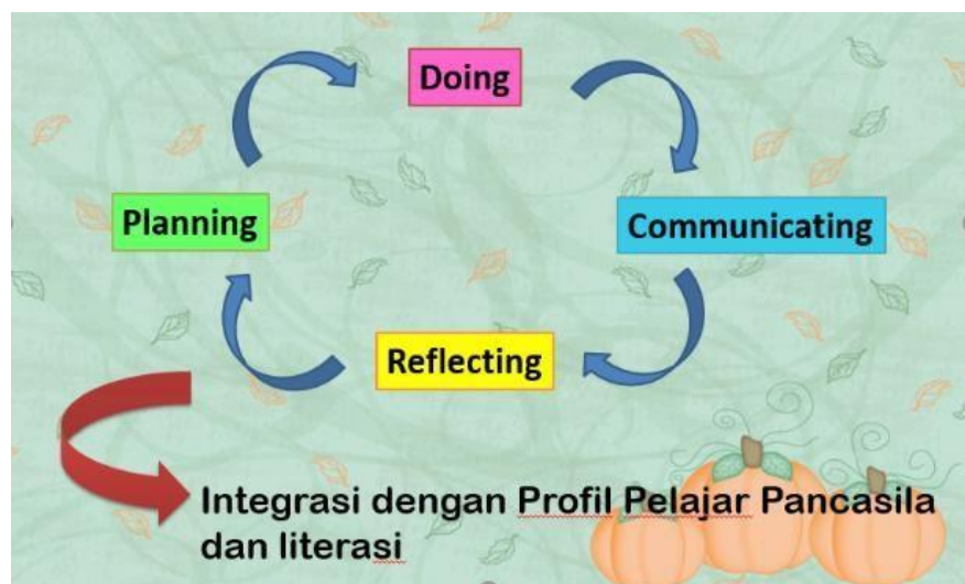
Gambar 2. Alur Pelaksanaan Pembelajaran

Rencana pembelajaran bersifat reflektif. Kontinuitas pembelajaran dapat terlihat dengan harapan tidak terjadi gap dan miskonsepsi dari pembelajaran sebelumnya. Dapat disusun mingguan yang tertuang ke dalam jadwal pembelajaran mingguan, namun catatan refleksi menjadi tambahan dalam kegiatan pembelajaran selanjutnya.